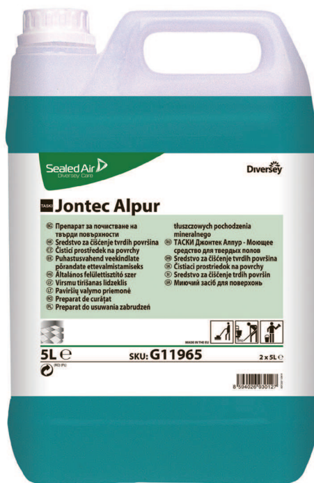
TASKI Jontec Alpur